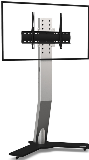
Simulation écran 55"

Références : EKINOXS4060DS EKINOXS6570DS